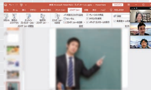
PowerPointの表示写真で即興ストーリー作り「パワポカラオケ」

「話をまとめる力」を強化できますし、うまく話せなくても失敗しても恥をかくことが安心してできる場です。どんな方でも大歓迎ですので、通りすがりに立ち寄ってみた、の感じで是非一度ご参加ください。こうあるべきという型にとらわれないで個々人の個性を尊重して、いいところを伸ばそうとする研鑽の場です。