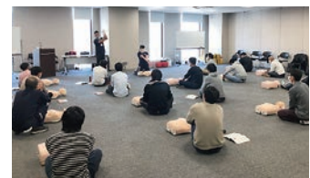
救命救急の実技講習

です。さらに同年、京都初の第78回全国産業衛生大会(主催:中央労働災害防止協会)を実施、会員事業所の方と実行