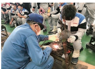
ガス溶接技能講習 (京都ポリテクセンターにて)

主な活動として、相談業務、毎月の機関誌の発行、労働局情報の発信、無料セミナーの開催による情報提供、支部単位で安全衛生大会や各支部の分科会での業種別や異業種との交流、情報交換の場づくり、また、京都府労働局長登録教習機関として労働安全衛生法上、必要な各種技能・特別教育等の講習を実施されています。その他、京都北部地域の中小零細事業場の健康保持増進のため、巡回健康診断事業による定期健診を行っていることは特徴的です。